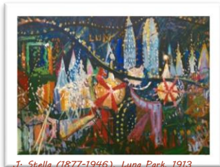
J. Stella (1877-1946), Luna Park, 1913